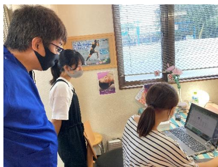
測定データはパソコンに送られます