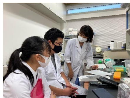
大学院生と研究方法の確認